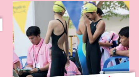
โอมเพียง! หลวงพ่อช่วยด้วย