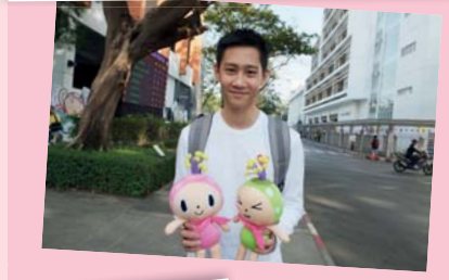
ลงคาตา ก่อนแข่ง