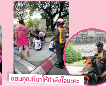
ขอบคุณที่มาให้กำลังใจนะคะ