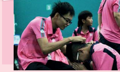
ลงคาตา ก่อนแข่ง