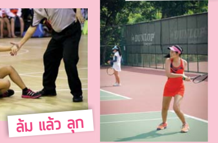
ล้มแล้วลุก